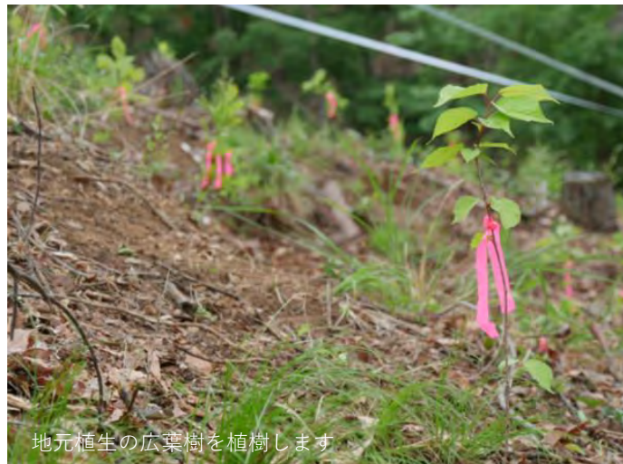
地元植生の広葉樹を植樹します