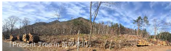
「Present Tree in 笛吹芦川」