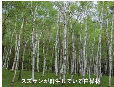
スズランが群生している白樺林