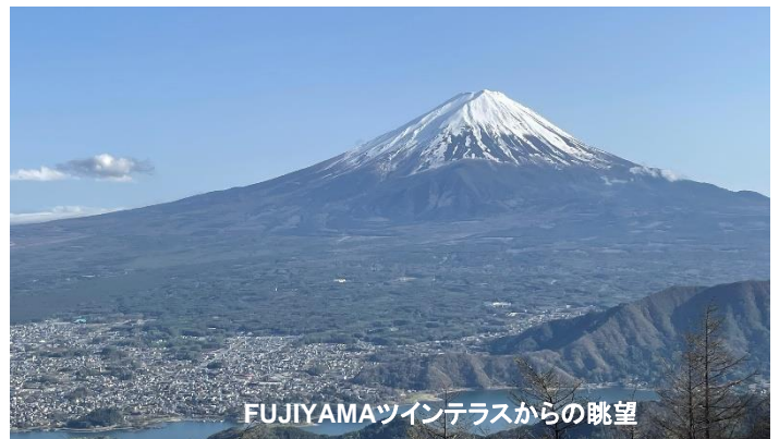
FUJIYAMAツインテラスからの眺望